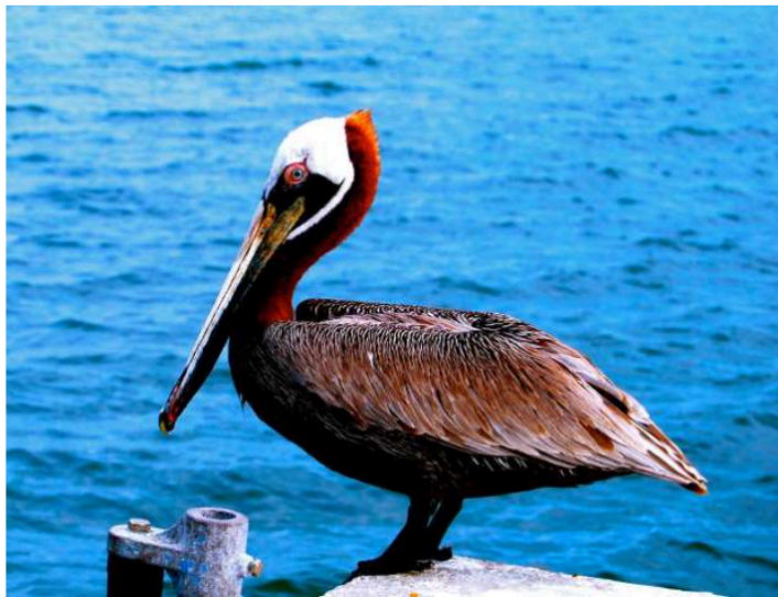
Gefiederte Einheimische der Keys: Pelikane

"Sportfishing capital of the world" nennt sich Islamodora ganz unbescheiden. Petrijünger freuen sich übers Hochseefischen im Atlantik oder das Angeln in der Florida Bay. Aber auch Touristen, die mehr Ruhe suchen, als sie es in Key Largo oder Key West finden, beißen an. Außerdem liegt Islamodora nur eineinhalb Fahrstunden von Miami entfernt und ist deshalb ein ideales Ziel für einen Tagesausflug. Eine gute, weil neue Adresse dort ist das Amara Cay Resort. Überschaubar in der Größe und ausgestattet mit außergewöhnlichem Interior Design, dem italienischen Gourmetrestaurant "Oltremare" und einem mit Palmen gesäumten Privatstrand liefert das Resort gute Gründe, es bei einem Kurztrip gar nicht erst zu verlassen. Andererseits: Wer nicht wenigstens einmal in Key West gewesen ist, hat die Florida Keys nicht gesehen. Deshalb für alle, die zum hop on - hop off dorthin fahren, ein paar Triptipps: